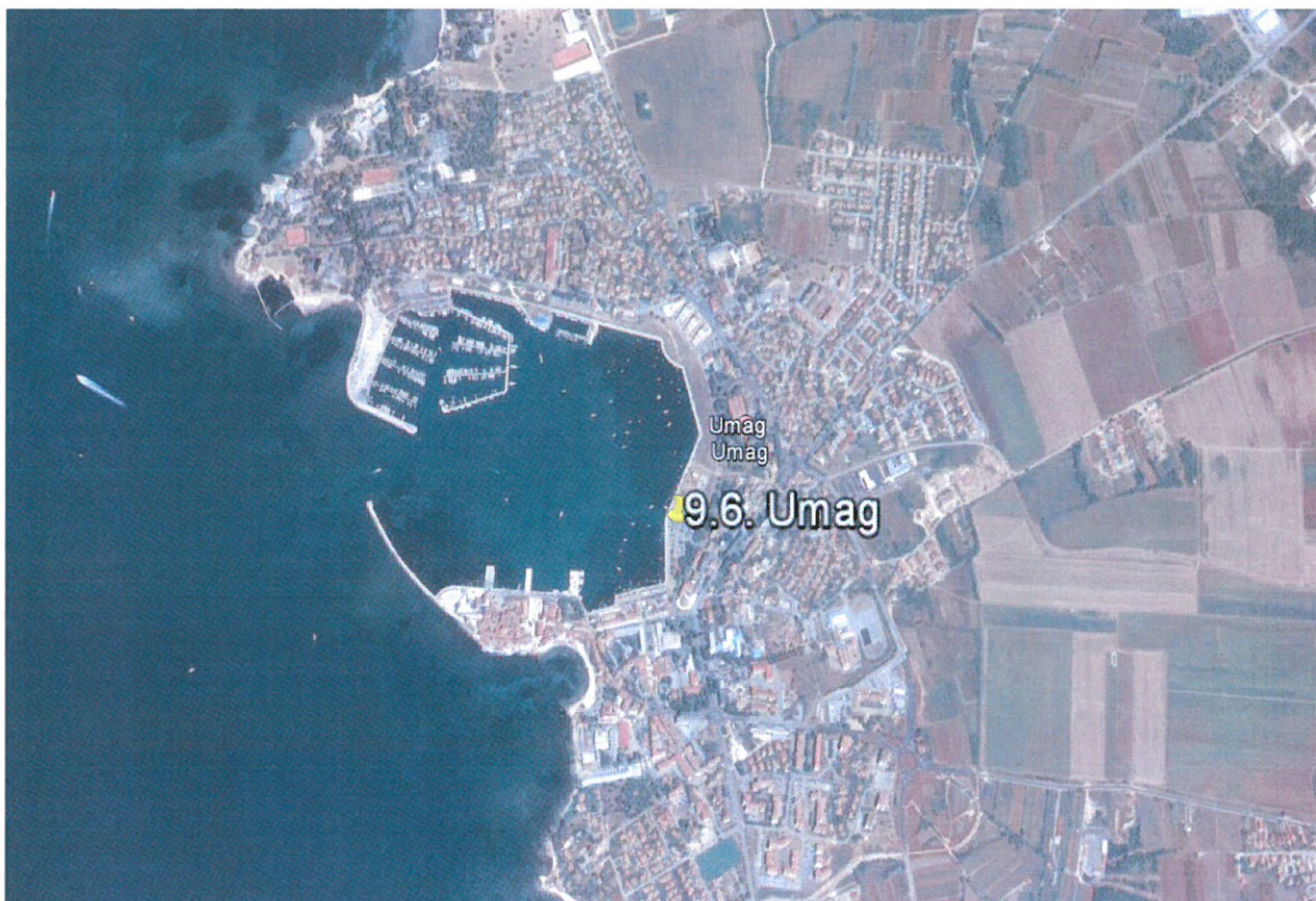
Slika 1. Lokacija mjerne postaje Umag

Za određivanje geografskih koordinata korišten je uređaj GPS-„GARMIN 60“ .