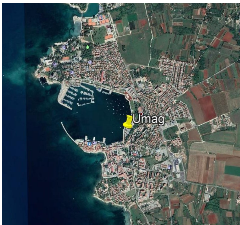
Slika 1: Lokacija uzorkovanja u Gradu Umagu

Mjerenja su uspostavljena 23.03.2018. godine, i obuhvaćaju kontinuirana mjerenja 1-satnih koncentracija sumporovog dioksida, praćenje količine ukupne taložne tvari i sadržaj istaloženih metala olova, kadmija, arsena, nikla, talija i žive po jedinici površine. Lokacija uzorkovanja prikazana je na Slici 1.